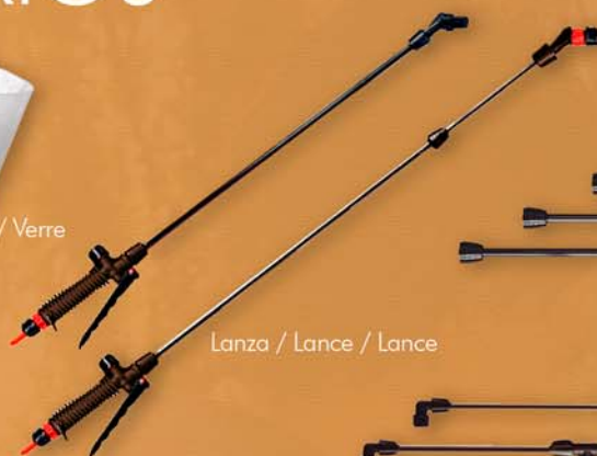
Lanza / Lance / Lance