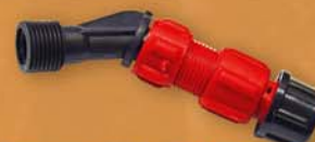
Conjunto boquilla Optima Set Optima nozzle Ensemble buse Optima

MÁXIMA SEGURIDAD Y EFICACIA EN SUS APLICACIONES HIGHEST SECURITY AND EFFECTIVENESS FOR YOUR WORK PLUS HAUTE SÉCURITÉ DANS VOS APPLICATIONS