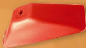
Campanas herbicidas / Herbicide hood Cloche herbicide