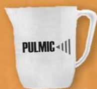
Jarra / Jar / Doseur